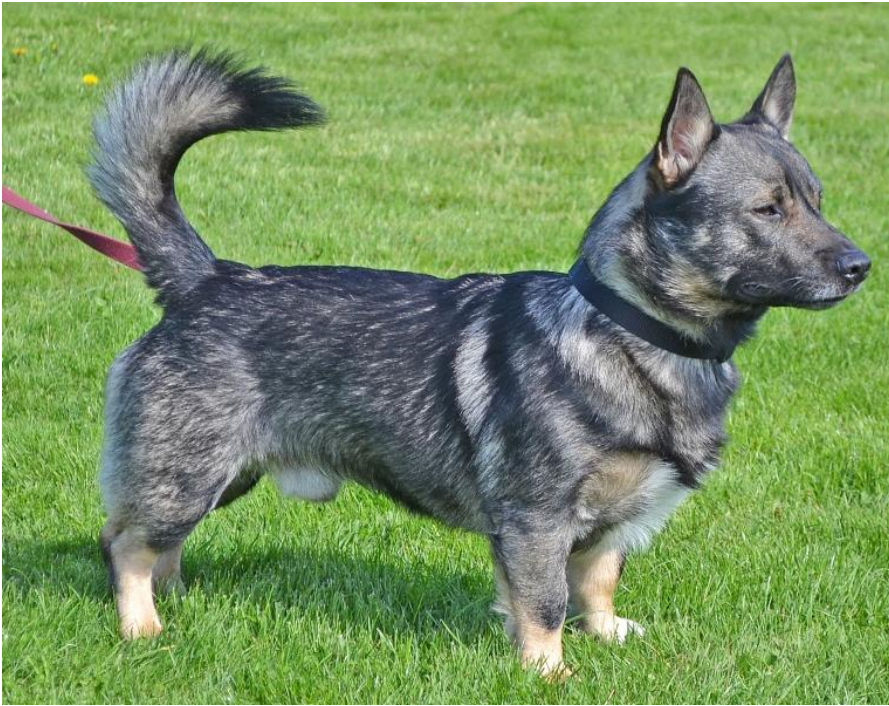
Sänningegårdens Ume Unikum